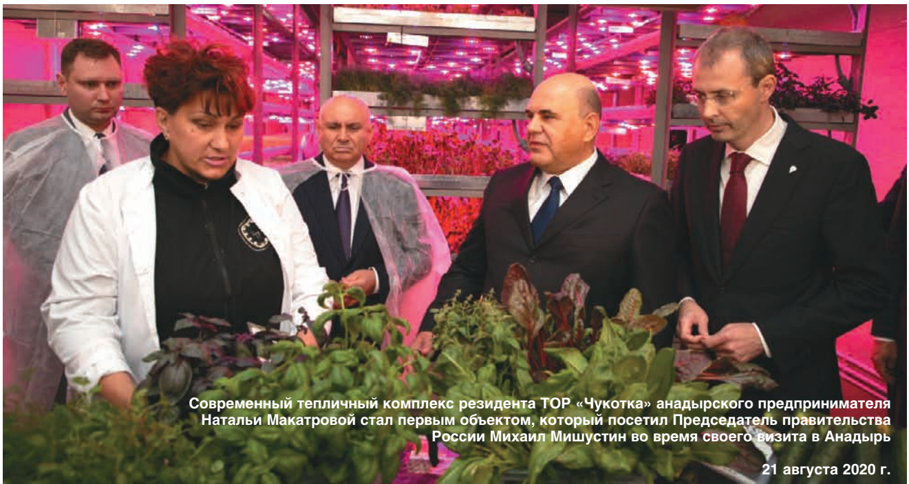
Современный тепличный комплекс резидента TOP «Чукотка» анадырского предпринимателя Натальи Макастровой стал первым объектом, который посетил Председатель правительства России Михаил Мишустин во время своего визита в Анадырь