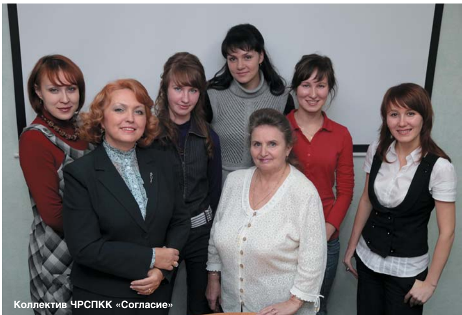
Коллектив ЧРСПКК «Согласие»