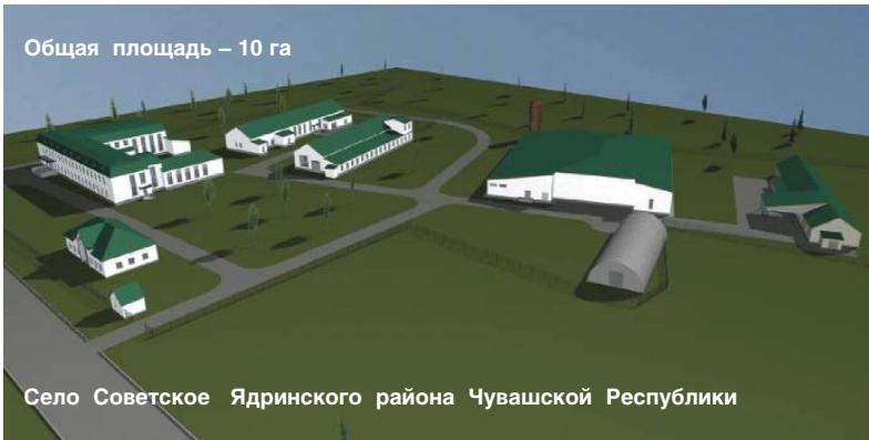
План-схема имущественного комплекса ОАО ГСК "Поддержка" с учебно-демонстрационными площадками.

Зинаида Воробьева: "Мы понимаем, что для достижения поставленных целей требуется постоянное обновление знаний и навыков. Для этого мы проводим конкурсы мастерства, профессиональные и психологические тренинги, направляем наших специалистов на различные курсы. С 2007 года на территории имущественного комплекса Государственной страховой компании "Поддержка" в селе Советское Ядринского района функционирует первый в России учебный центр с демонстрационными площадками на базе сельскохозяйственных потребительских кооперативов и расположенных неподалеку представительства компании и кредитного кооператива "Советское-Согласие".