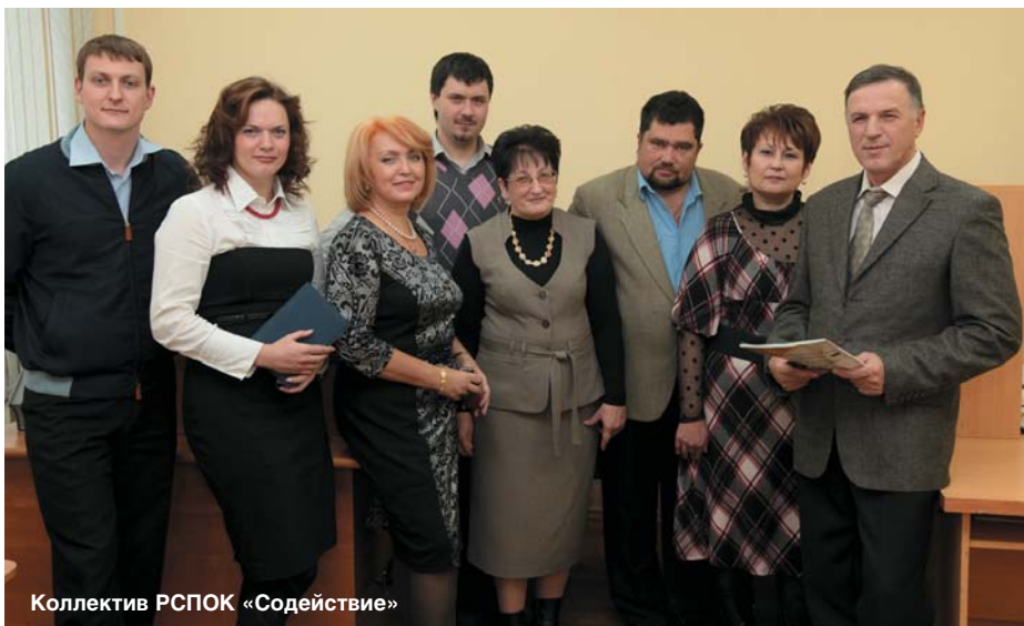
Коллектив РСПОК «Содействие»

Активно содействуя созданию благоприятных условий для стимулирования развития малых форм хозяйствования на селе, Государственная страховая компания "Поддержка" не осталась в стороне на этапах создания и становления ряда сельскохозяйственных потребительских кооперативов других видов деятельности, таких как "Рябинка" (сбытовой), "Дары природы" (перерабатывающий), "Нива" (обслуживающий) и "Народные промыслы" (обслуживающий). Страховая компания передала кооперативам в аренду на приемлемых для них условиях здания своего имущественного комплекса, который находится в селе Советское Ядринского района. Для нормального функционирования кооперативов за счет средств страховой компании восстановлены системы газификации, электрификации, отопления, водоснабжения и канализации. Проведена реконструкция офиса с оборудованием конференц-зала на 30 посадочных мест и гостиничных номеров.