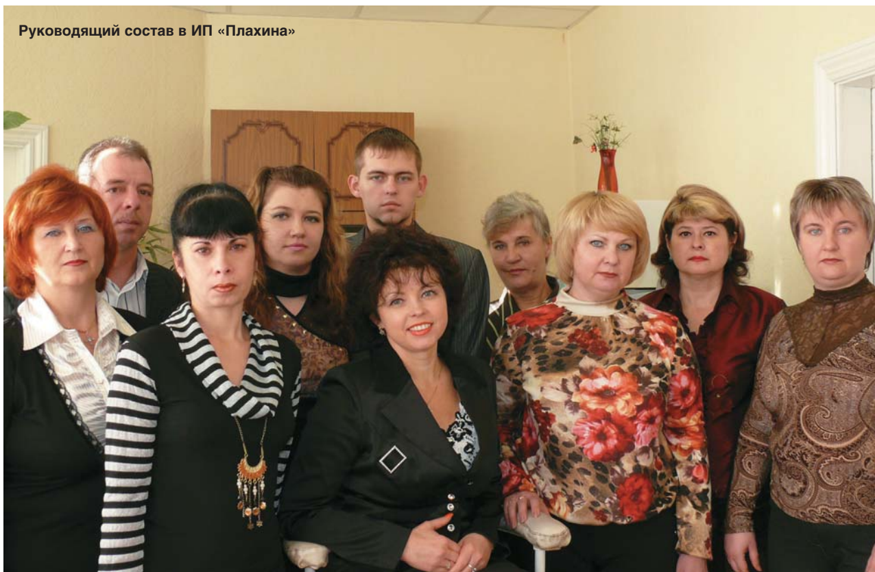
Руководящий состав в ИП «Плахина»